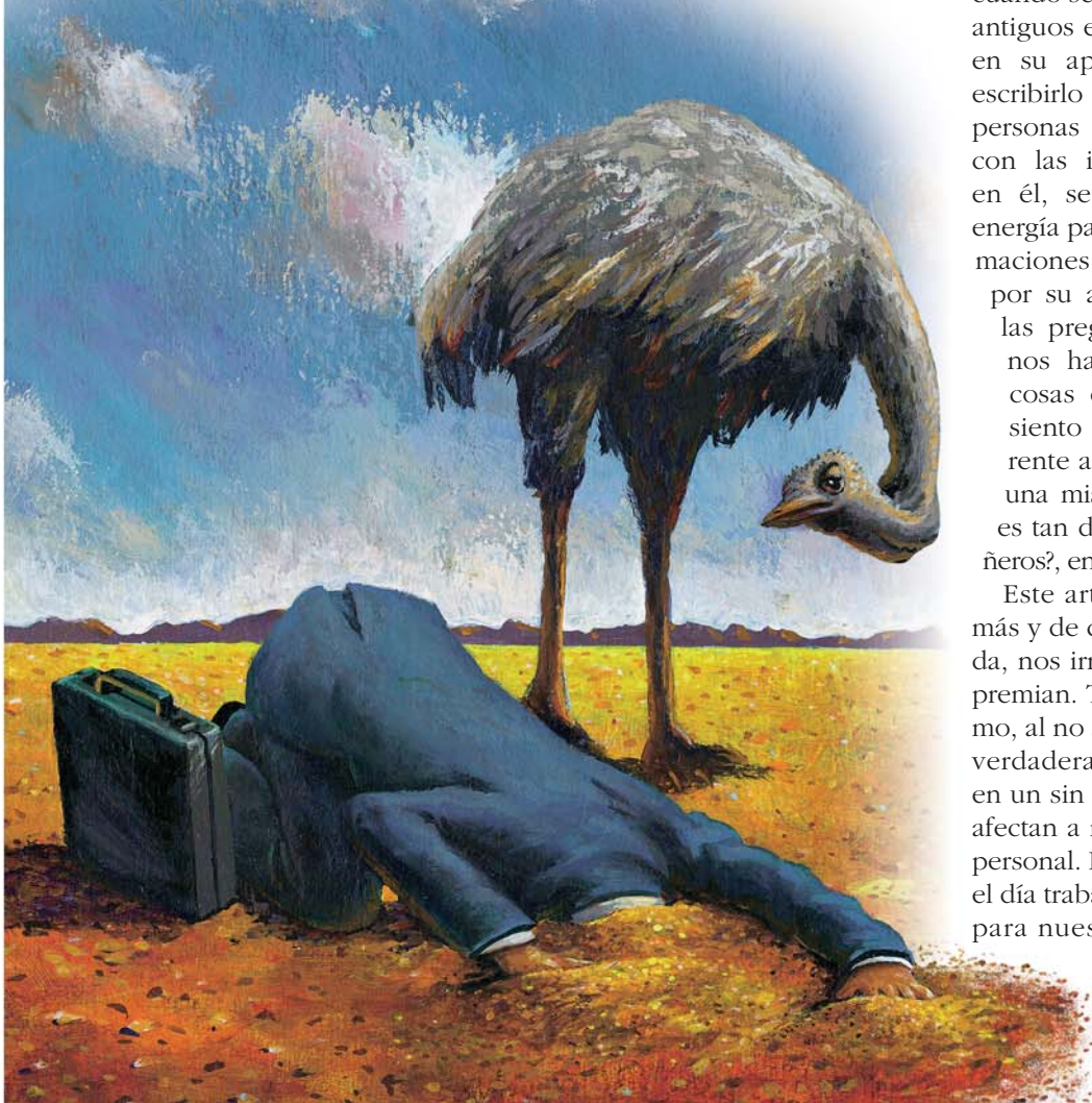
Stephen F. Hayes